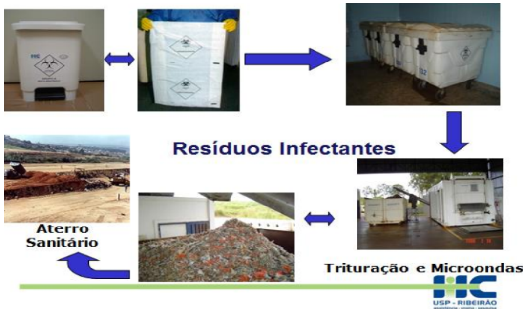
Figura 1. Processo de coleta, armazenamento e descarte dos resíduos infectantes e perfuro cortantes A e E

Na figura 1 temos um diagrama de fluxo da maior parte dos RSS do Hospital das Clínicas da Faculdade de Medicina de Ribeirão Preto HCFMRP (grupo II), este é o modelo seguido pelo grupo Estre responsável pelo tratamento no município de Ribeirão Preto [HCFMRP 2021]. O HCFMRP se encaixa no grupo II grande gerador, mas também produz e trata resíduos grupo I e III.